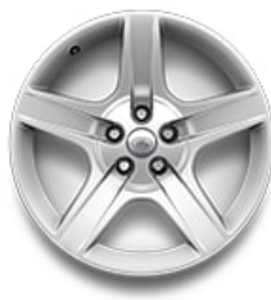
OPCIONES DE RINES