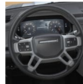
SELECTOR DE VE- LOCIDADES