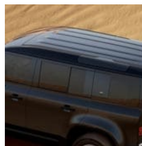
COLOR DEL TECHO